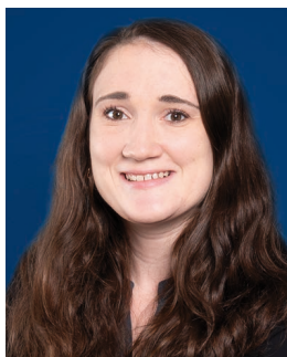
Autorin: Dr. Janine Müller Teamlead Data Science & AI BTC AG www.btc-ag.com

Auch in der innerbetrieblichen Logistik eröffnet Vision AI neue Möglichkeiten. Autonome Flurförderzeuge nutzen Kameras, um ihre Umgebung zu erfassen, Hindernisse zu erkennen und Routen flexibel anzupassen. Das System reagiert auf veränderte Bedingungen, etwa wenn Paletten im Gang stehen oder Lichtverhältnisse wechseln. Fahrzeuge können so sicher autonom navigieren und sorgen für kontinuierliche Materialflüsse.